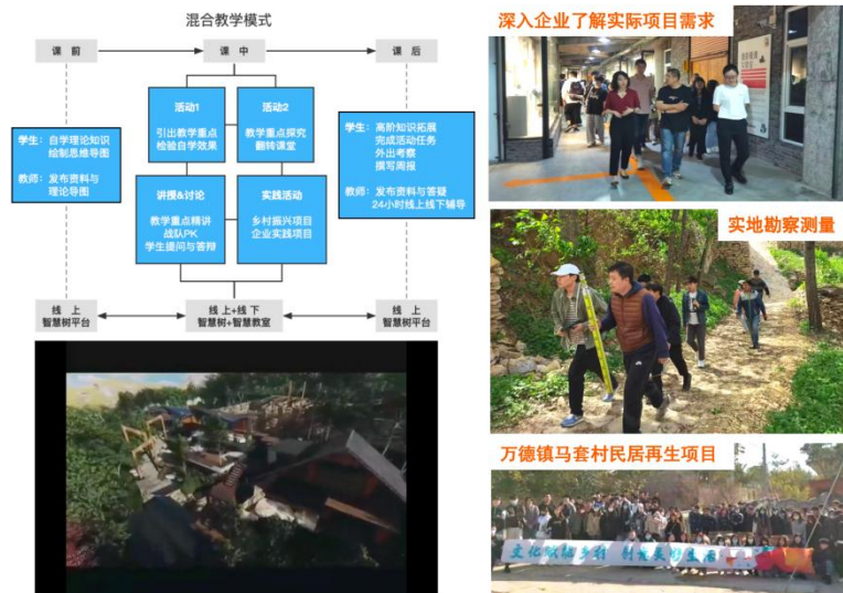
图 学、产、研一体化教学模式

环境设计专业坚持以教科研项目和教学改革项目促进教学质量的不断提高，为更好地培养创新型、应用型设计人才，环境设计专业根据设计学院的教