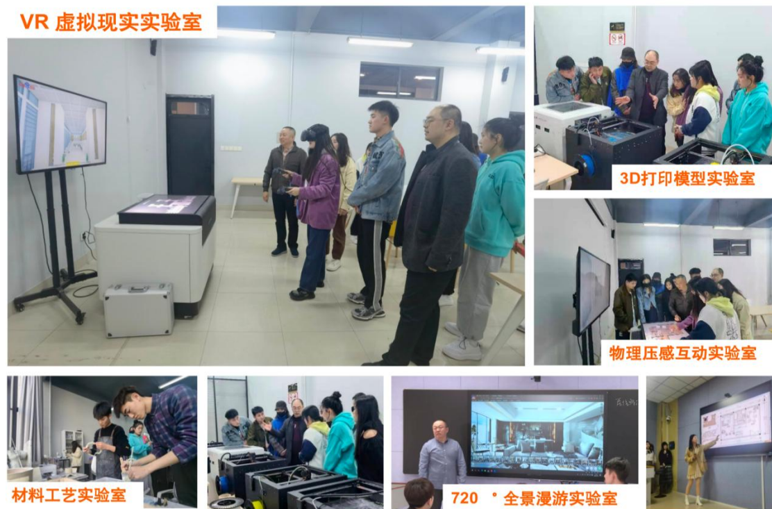
图 多元化教学资源 深化教学模式

环境设计系的 5 个工作室都已经设置多媒体教学设备，几乎所有的专业课程均可通过电脑、投影仪等采用多媒体课件进行授课。多媒体课程资源和数字化文献资源建设卓有成效，近年来积极推进网络课程建设，工作室新型课程模式建设已初见成效，在学校和设计学院的统一协调部署下，环境设计专业师生迅速通过各种网络平台及时开课，如：《超星学习通》是我们学院教务处推荐的，由北京世纪超星信息技术发展有限责任公司开发的，面向智能手机、平板电脑等移动终端的移动学习专业平台。用户可以在超星学习通上自助完成图书查询、电子资源下载、学习学校课程，进行小组讨论，等教学功能，同时平台还拥有大量的电子图书，报纸文章以及中外文献元数据，可以为用户提供方便快捷的移动学习服务。同时疫情期间，腾讯对 QQ 进行了改版，增加了“群课堂”等教学直播功能，老师可以很方便的对同学们进行直播教学讲解。