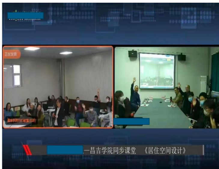
图 《居住空间设计》慕课西行课堂

在具体的教学方法上,有通过直播和录播两种方式在课堂派和学习通两个平台上交叉进行,如;课堂派平台直播,讲解上传的自制 PPT 课件,通过直播期间的投票、评价、匿名开放、拍照、选择、判断、简答等多种互动题型,实时分析互动答题情况,一键提取学生有效观点,及时检验教学效果。同时课堂直