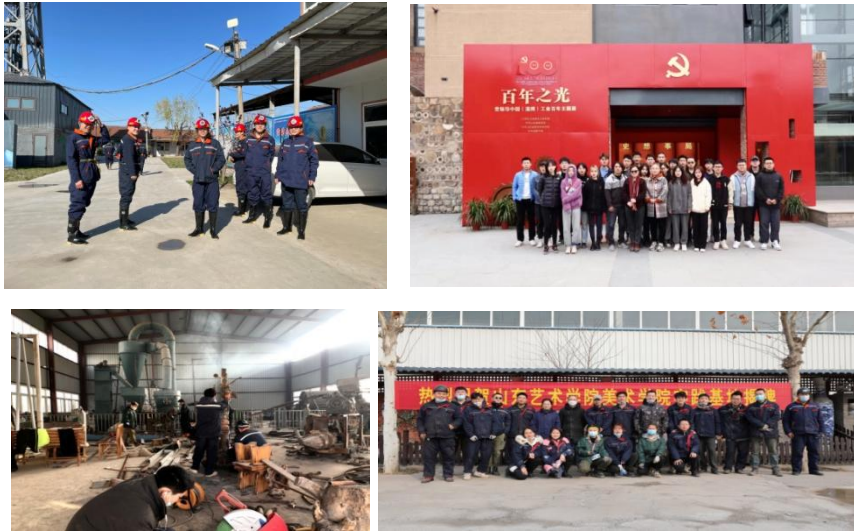
艺术实践和实习基地建设

积极配合学院并提供实验室场地和设备。老师带领学生积极参与大型艺术实践项目,以展促教,在社会上形成了积极影响。2020 年寒假期间,老师带领学生到山东济南沃泰耐火材料有限公司地下开采矿实地考察,并参加了为期三周的艺术实践活动,全面服务学生成长成才,丰富成果得到众多好评。